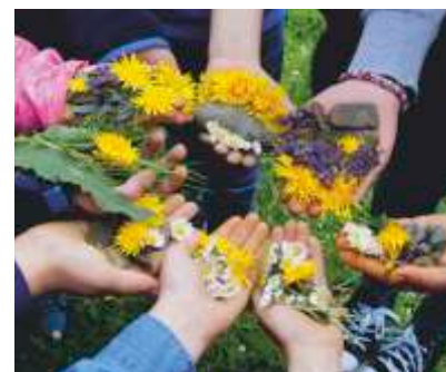
Kunstprojekt Landart „Gemeinschaft“