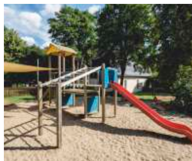
Spielplatz direkt am Haus

Um Ihr Kind bestmöglich zu fördern, streben wir eine gemeinsame, ganzheitliche Erziehung an: Wir legen Wert auf partnerschaftliches Miteinander und offenen Dialog. Die Mitbestimmung und Mitwirkung von Eltern in unserer Kita ist unser Ziel.