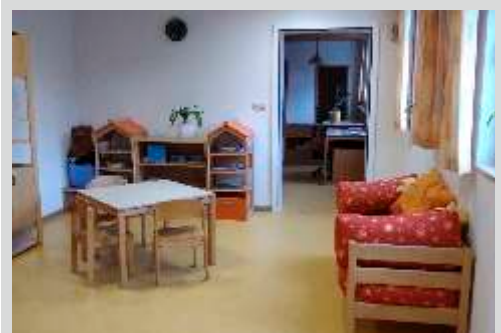
Eingang zum Gruppenraum