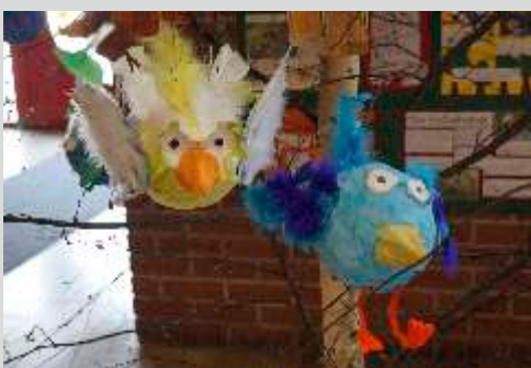
Kunstprojekt: Bunte Vögel - jeder ist anders