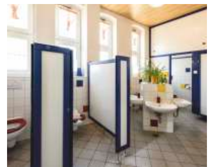
Toiletten und Waschraum