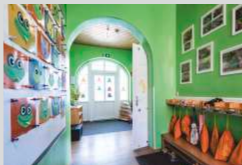
Flur mit Garderobe

Unsere kleine, familienähnliche Kindertagesstätte liegt im Mittelpunkt des Ortsteils Lauenhain in Ludwigsstadt. Angrenzend befindet sich ein öffentlicher Spielplatz mit vielen Spielgeräten zum Austoben. Die Wanderwege, Wald- und Wiesengebiete rund um Lauenhain nutzen wir für Ausflüge und Exkursionen.