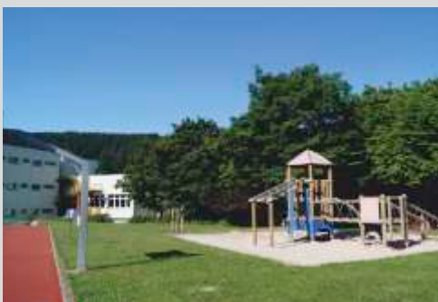
Spiel- und Pausenhof mit Sportanlage

Wir sind eine kleine Schule mit derzeit 5 Grundschulklassen und einem großen Schulgebäude mit viel Bewegungsmöglichkeiten im Innen- und Außenbereich. Ein wertschätzender und vertrauensvoller Umgang mit allen Beteiligten unserer Schulfamilie steht für uns an erster Stelle.