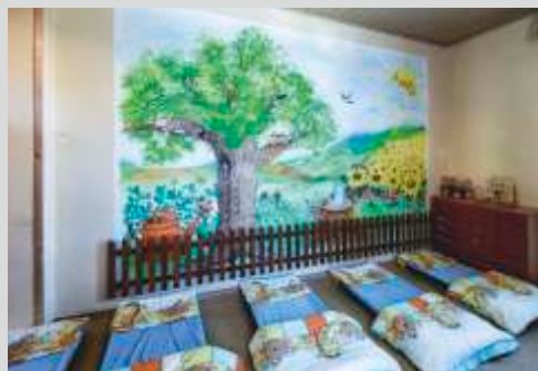
Schlafräum für den Mittagsschlaf