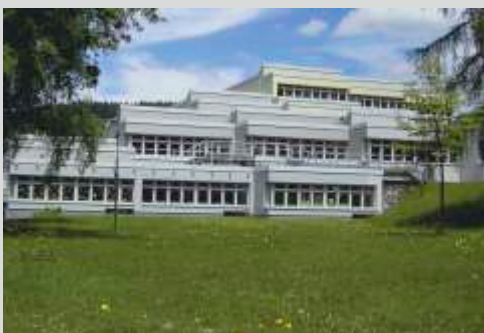
Unser Schulgebäude im Grünen

Auf unserer Homepage finden Sie ausführliche Informationen zu unserem Leitbild und allen Aktionen unserer Grundschule!