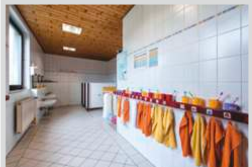
Toiletten und Waschraum