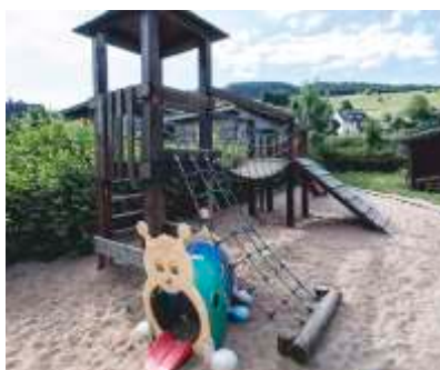
Spielplatz direkt am Haus