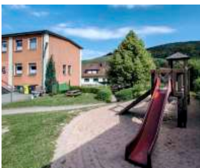
Unsere Einrichtung mit Spielplatz

„Kommen Sie mit ihrem Kind vorbei und schauen Sie sich das Leben im Kindergarten Ebersdorf live und in Farbe an!“