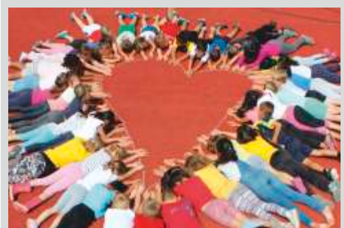
Gemeinsam sind wir ein Team