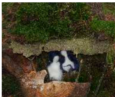
Waldtag „Den Wald mit allen Sinnen erleben“